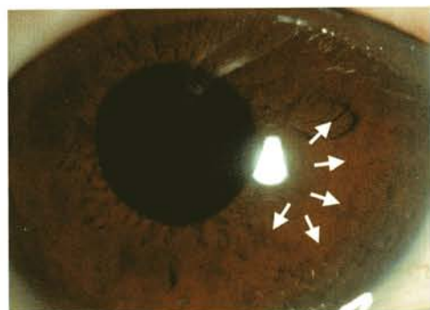
糖尿病網膜症患者の虹彩血管新生に対するAVASTIN硝子体注射の治療前後

加齢黄斑変性の治療薬として、昨年秋から今年春にかけて2つの抗VEGF薬が認可されました。しかし、適応疾患はあくまでも加齢黄斑変性に限られており、今後もAVASTIN ® は手放せない薬剤です。（安原 徹）