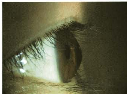
図2 中等度の円錐角膜。

円錐角膜の軽症例では、細隙灯所見に異常を認めないために角膜形状解析が有用です。円錐角膜は中央から下方が突出するため、初期には角膜中央のマイヤー像が耳下側を向いた卵形となります。進行すると突出が強くなるので、中央のリングが小さく、角膜下方のリング間隔が狭く上下が非対称となり、さらに進行すると全体のリング間隔が狭くなります。