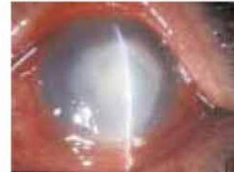
図3 円盤状角膜混濁