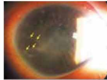
図1 放射状角膜神経炎