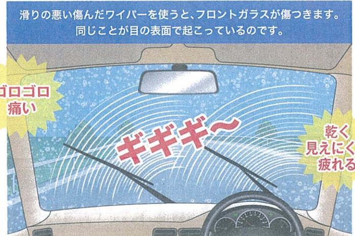
滑りの悪い傷んだワイパーを使うと、フロントガラスが傷つきます。同じことが目の表面で起こっているのです。