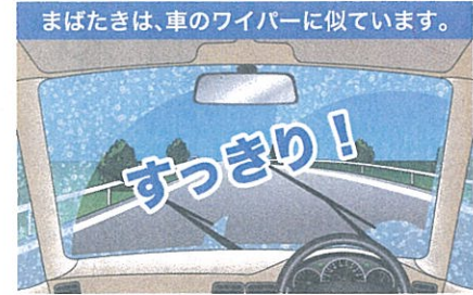
まばたきは、車のワイパーに似ています。